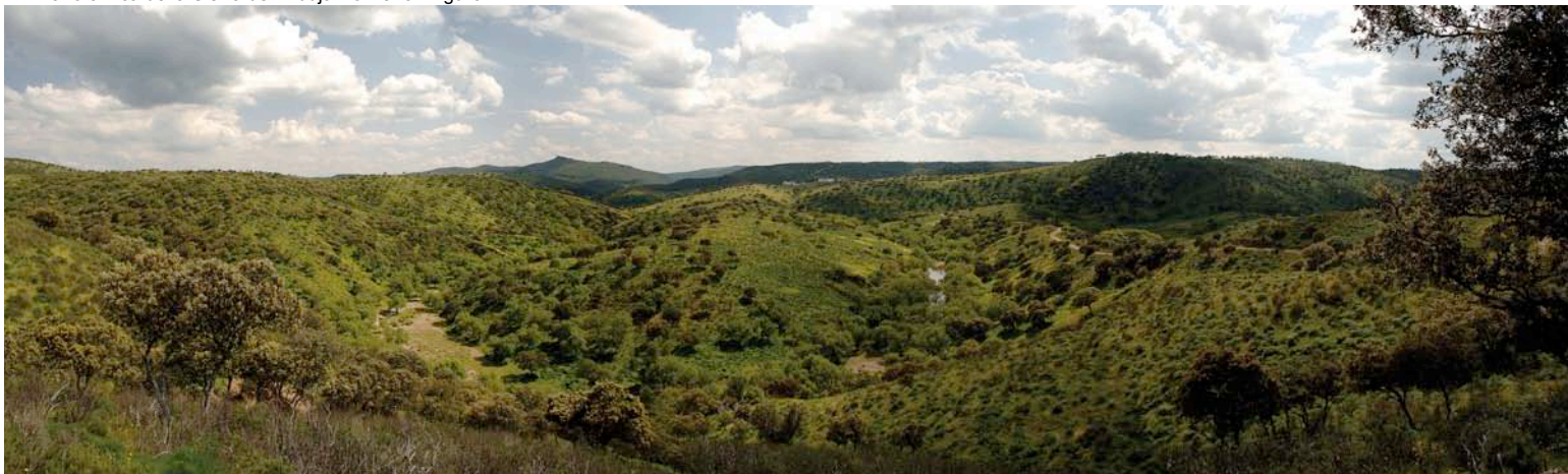
Panorámica de la Sierra de Andújar.

Sólo se considerará efectiva la reserva una vez recibido el pago.