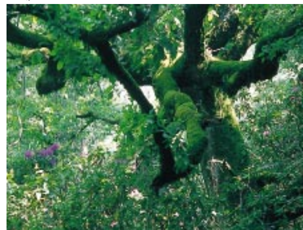
▶ Los Alcornocales son un marco excepcional para llevar a cabo una experiencia piloto sobre la aplicación de la Directiva en España.

vista, y de su importancia para la conservación de nuestros espacios naturales.