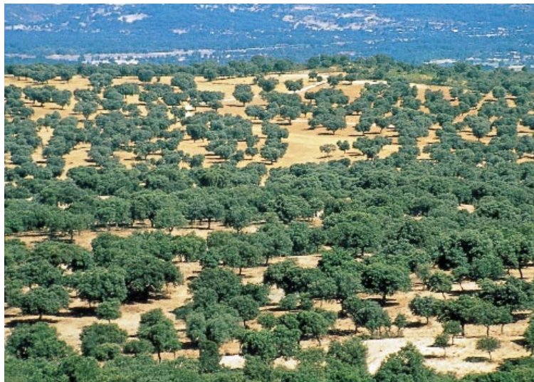
▶ España y Francia han presentado listas incompletas de LICs para la región mediterránea, lo cual supone un nuevo retraso en el proceso para crear Natura 2000 .

importante se confirmó: no se va a crear un fondo comunitario nuevo específicamente para financiar Natura 2000 , sino que los Estados miembros deben aprovechar los instrumentos y las medidas existentes (LIFE, Fondos Estructurales y de Cohesión, la PAC, etc.). Además, el representante de la DGXI recordó a los gobiernos de los quince Estados que la Directiva Hábitats promete la cofinanciación de ciertas medidas mediante estos instrumentos, pero no su financiación total. Los mismos Estados también tienen que asumir su parte de los costes de la red.