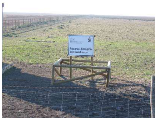
La Reserva Biológica del Guadiamar, propiedad de WWF desde 1968