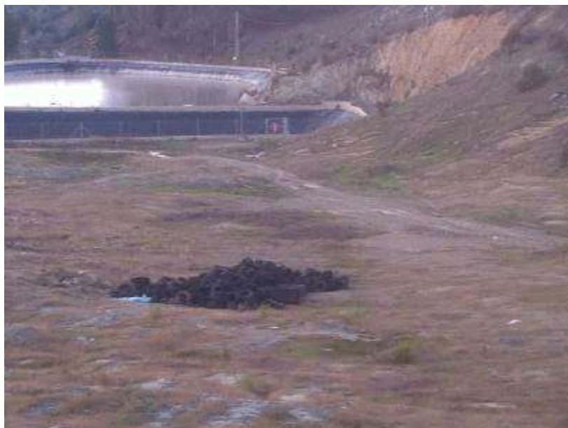
Vertedero de RSU de Villarrasa

WWF considera necesario que estos hechos se investiguen hasta el final por la Fiscalía de Huelva, ya que se podrían estar produciendo delitos contra el medio ambiente y la salud humana de confirmarse las denuncias realizadas por los propios trabajadores de la planta.