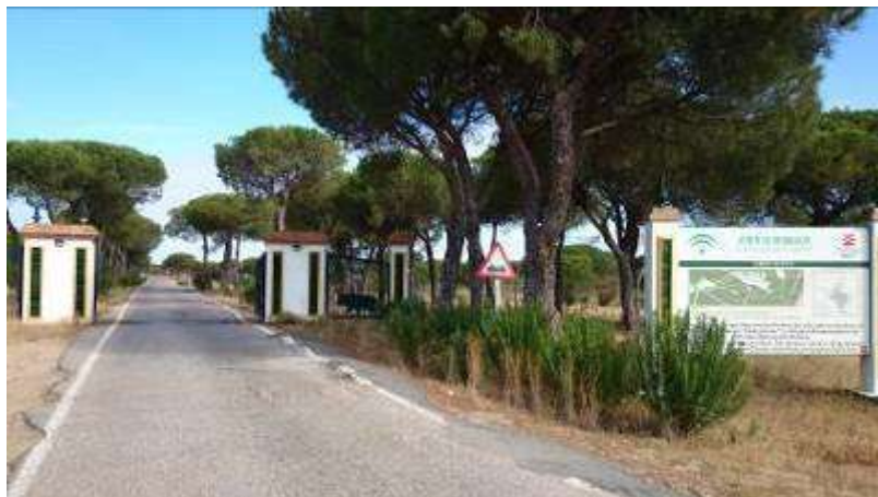
Entrada al Espacio Natural de Doñana en el Acebuche

Hay que recordar que a principios de 2015 está prevista una visita de UICN, UNESCO y la Secretaría del Convenio de Ramsar para evaluar el estado de Doñana y su gestión.