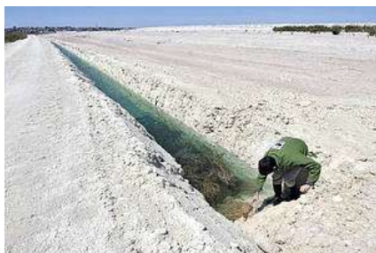
Balsas de fosfoyesos en Huelva