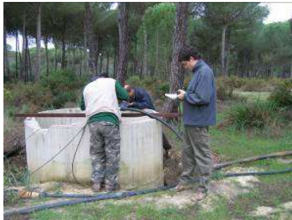
Inspeccionando un pozo ilegal en un pinar público

Cuatro años después, los organismos internacionales han vuelto a Doñana en una nueva misión –que se celebra del 14 al 17 de enero- para comprobar el cumplimiento de sus recomendaciones de 2011, y de las presentadas posteriormente en 2013 y 2014 a las autoridades españolas. El jueves, WWF se reunirá con los responsables de la misión para transmitirles que Doñana sigue en peligro y que sus recomendaciones no se han cumplido por la inacción y la falta de coordinación entre las administraciones competentes. Al mismo tiempo, han disminuido los recursos materiales y económicos para el Espacio Natural de Doñana.