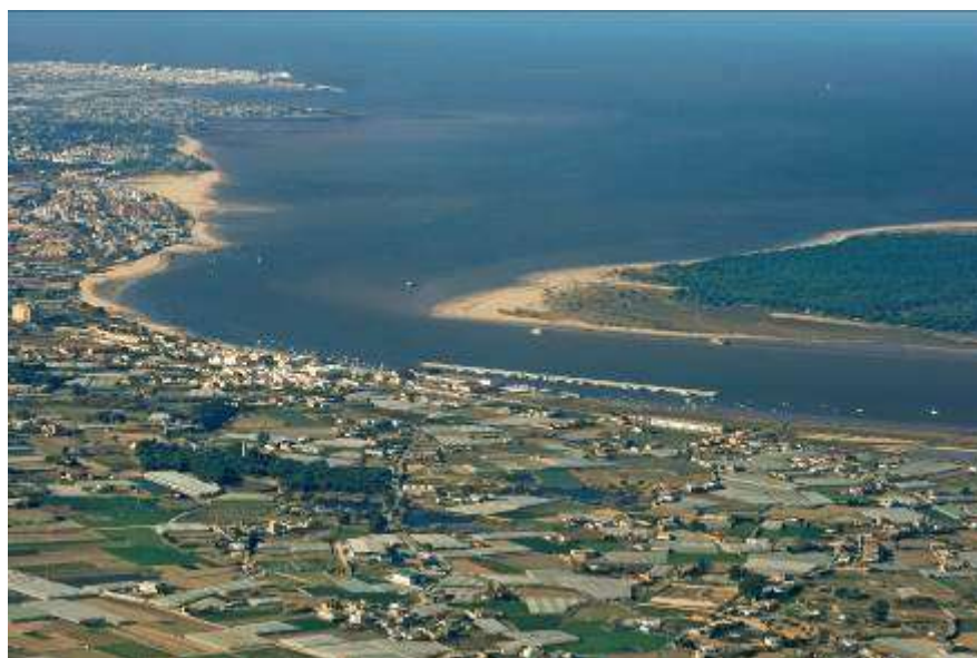
Desembocadura del Guadalquivir, a la derecha el Parque Nacional de Doñana