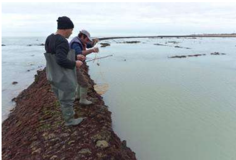
Pesca de camarones en Chipiona

Este Dictamen –que desde 2011 es parte integrante de la DIA del proyecto de acuerdo con una comunicación de la Secretaría de Estado de Cambio Climático a la Autoridad Portuaria de Sevilla- ha sido asumido y apoyado públicamente por agricultores, municipios ribereños, ecologistas o el propio Gobierno de Andalucía . El ejecutivo andaluz tanto en sede parlamentaria, como en los medios de comunicación o en cartas e informes remitidos al gobierno de la nación y a organismos internacionales, ha defendido que antes de llevar a cabo el dragado de profundización, hay que tomar diversas garantías y llevar a cabo actuaciones de recuperación del estuario, entre las que señala la aplicación del Dictamen de la Comisión Científica para el Estudio de las Afecciones del Dragado del Río Guadalquivir.