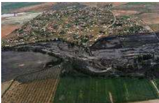
Los lodos de Aznalcóllar en los Ranchos del Guadiamar (Santlúcar la Mayor). Abril 1998

WWF está seriamente preocupada por la gestión de los residuos y las aguas contaminadas que dejó Bolidén Apirsa S.A, los cuales se pondrán en manos de una empresa que trae un historial contaminante. El último ejemplo ha sido el vertido de la mina Buenavista en México ( http://www.iagua.es/noticias/mexico/salvemos-cabana/14/08/15/la-rotura-de-una-balsa-en-una-mina-de-oro-mexicana-provoca ). Seis meses después asociaciones mexicanas denuncian que la empresa aún no ha respondido de los daños causados ( https://www.facebook.com/GrupoAmbientalHabitat/posts/1044956658864692 ).