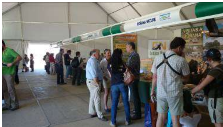
Feria Bird Fair 2014

Para más información: http://www.donanabirdfair.es/?page_id=2