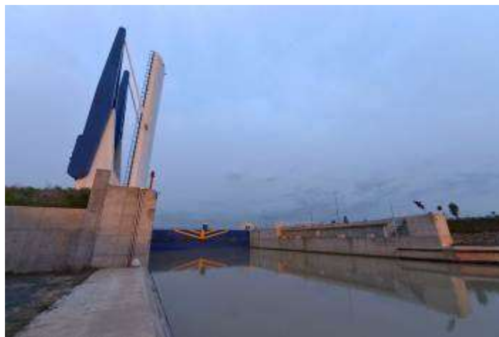
Nueva esclusa del Puerto de Sevilla

El Tribunal considera que el dragado no tiene cabida en el Plan Hidrológico porque contradice los objetivos de mantener en buen estado el Guadalquivir. La sentencia afirma que “Los riesgos que comporta la actuación del dragado del canal, cuya necesidad no aparece explicada ni justificada en el plan, se ponen de manifiesto en la denominada “propuesta metodológica para diagnosticar y pronosticar las consecuencias de las actuaciones humanas en el estuario del Guadalquivir”, realizado por el Centro Superior de Investigaciones Científicas, que consta en el expediente administrativo, y en el Dictamen de la Comisión Científica” .