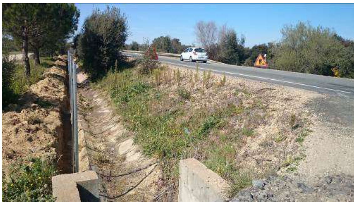
Obras en la A481

WWF considera esta actuación como un paso importante para ir solucionando los problemas de atropellos de lince en las carreteras de Doñana, aunque indica que es necesario establecer plazos de ejecución para el resto de las medidas previstas.