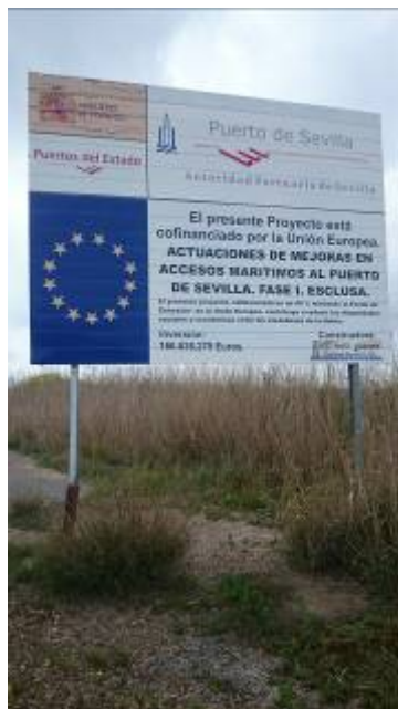
Cartel de las obras de la esclusa en la Puerto de Sevilla

Desde un principio se han querido vincular los fondos europeos al “dragado del Guadalquivir”, de forma que o se ejecutaba el mismo o había que “devolver el dinero”, como afirmó, por ejemplo, la Plataforma “Sevilla por su puerto” en enero de 2015 .