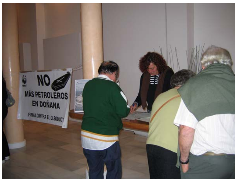
Recogida de firmas contra el oleoducto en Moguer

En caso de vertido el medio natural quedaría afectado, y en consecuencia también actividades económicas esenciales para la provincia de Huelva como la pesca, el marisqueo o el turismo.