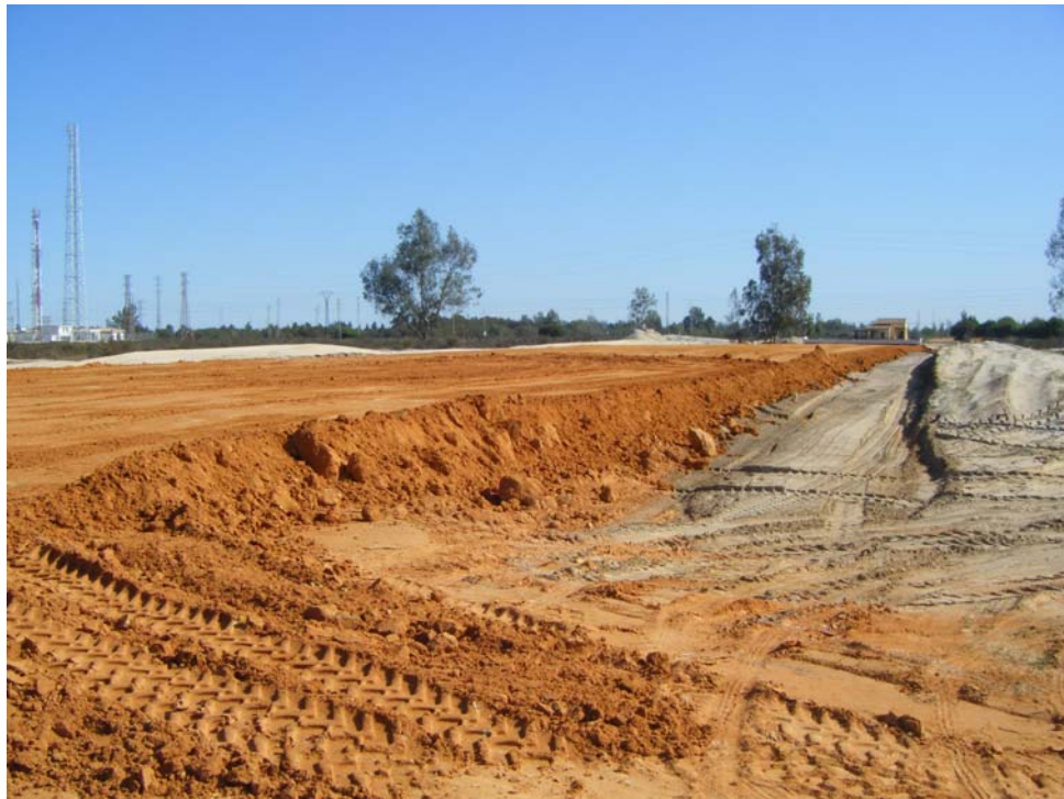
Obras de la variante del Rocío

En general WWF considera que las actuaciones deben enfocarse sobre la trama de carreteras y caminos y no sobre tramos de la misma. Es imprescindible un doble enfoque considerando una escala espacial (la interacción de las especies con el territorio) y una escala temporal (las diferentes fases de actuación) de manera que en primer lugar se trabaje en medidas paliativas de emergencia y en segundo lugar se trabaje con medidas más eficaces y realmente definitivas, que resultarán de aplicación más lenta. Asimismo, a la hora de mejorar la conectividad de los espacios naturales de Doñana, tanto a nivel interno de la Comarca, como con otros espacios exteriores mediante una red de corredores ecológicos que conecten el territorio, es necesario considerar tanto las características ambientales de la zona como las necesidades espaciales de las especies más amenazadas –como el lince-, que deberían lógicamente primar sobre cualquier otro condicionante.