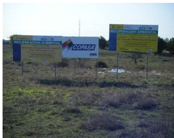
Diversas obras del Proyecto Doñana 2005

Este plan debería resolver los problemas tanto de cantidad como de calidad de las aguas del Espacio Natural de Doñana. En este sentido, WWF defiende que Doñana se puede salvar de la desertificación si se consigue un aporte natural de 200 hm 3 de agua al año, frente a los 75 que recibe ahora este humedal, una cifra mínima que le impide conservar sus ecosistemas.