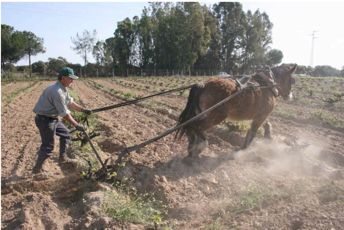
Labores de arado en un viñedo tradicional de Villamanrique

Sin embargo, la permanencia del viñedo se ve amenazada no sólo por la elevada edad media de los viticultores -que en muchos casos no encuentran relevo generacional para su actividad-, sino también por la reforma de las ayudas europeas al sector vitivinícola (reforma de la OCM), que promueven el arranque de los viñedos menos competitivos. WWF ha criticado duramente dicha reforma porque son precisamente estos viñedos los que suelen mantener prácticas agrícolas y variedades autóctonas más adaptadas al medio, además de tradiciones asociadas a la cultura local que, de otra forma, se perderían.