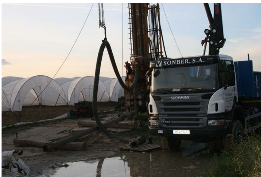
Construcción de un pozo en Matalagrana

El informe de WWF sobre las necesidades hídricas de Doñana señala que en 1992 la extracción de agua del acuífero Almonte-Marismas para regadío ya se cifraba en 71 hm 3 al año. En 2006, la estimación realizada aumentaba este número hasta 81-98 hm 3 , lo que supone una reducción en el 90% de los aportes de dicho acuífero a la Marisma de Doñana, y resaltaba que la mayor parte de dicha extracción era ilegal