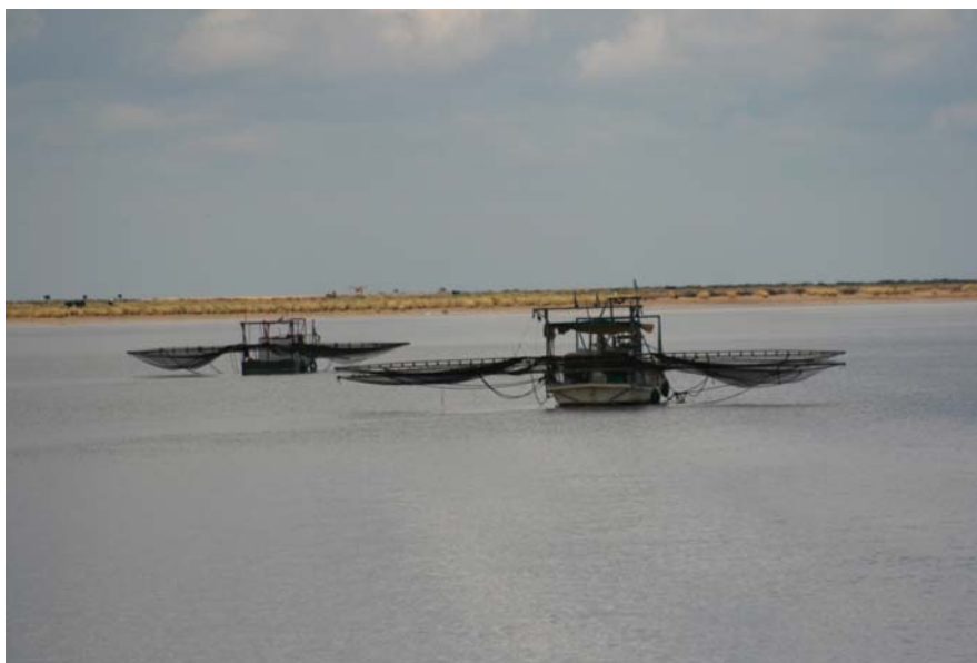
Barcos riancheros en el Guadalquivir

Además durante el 2010 debe quedar finalmente descartada una de las grandes amenazas que penden sobre el futuro de Doñana: el dragado del río Guadalquivir.