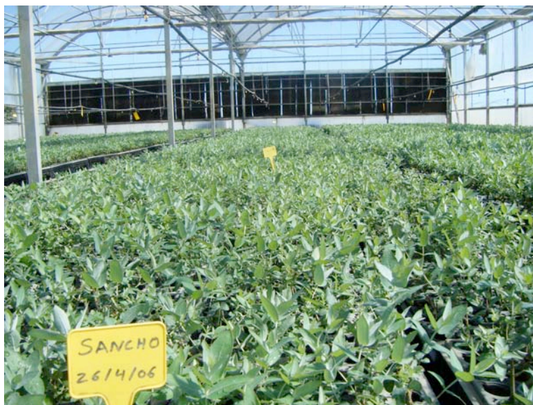
Plantones de eucalipto

Por último, la Consejería de Medio Ambiente debe establecer qué medidas llevará a cabo para impedir nuevas plantaciones de eucaliptos en la Comarca de Doñana y avanzar en la declaración de la misma como "Zona Libre de Eucaliptos".