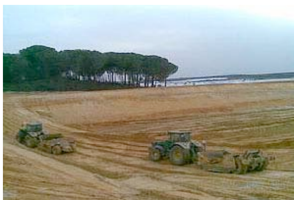
Balsa denunciada: fase de construcción

WWF informó de estos hechos al Seprona y la Consejería de Medio Ambiente, que tomaron las medidas oportunas para la paralización de las obras, las cuales llevaban ejecutándose durante más de un mes sin que la Administración Andaluza o el Ayuntamiento de Almonte hubieran actuado para impedir esta ilegalidad.