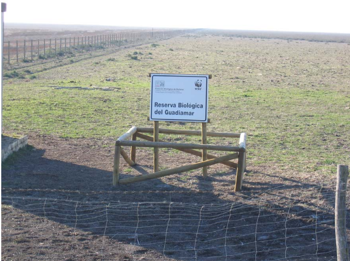
Reserva Biológica del Guadamar, propiedad de WWF-España