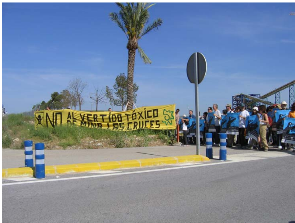
Protesta contra el vertido de las cruces con motivo del 10º aniversario de la catástrofe de Doñana

La Mina de las Cruces deberá reutilizar el agua procedente del proceso minero en dicho proceso, de forma que sea innecesaria la toma de agua de la EDAR de San Jerónimo y otras fuentes. El agua que no pueda ser reutilizada deberá ser depurada con calidad de agua potable y se estudiará su uso en la zona para evitar que se vierta al Guadalquivir. De esta forma se asegura el “vertido cero” y se atiende una de las principales propuestas de los grupos ecologistas para impedir los impactos de la Mina de las Cruces sobre el Guadalquivir y el Espacio Natural Doñana.