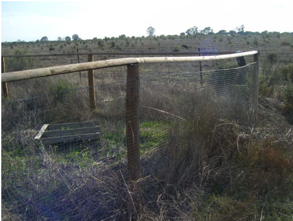
Cercado de alimentación suplementaria para lincees

Todo ello a pesar de los esfuerzos de investigadores, guardería y el personal de gestión del Espacio Natural, la Estación Biológica de Doñana o el proyecto Life, que durante este 2009 han construido cerca de 200 majanos y cercados de cría de conejo, han soltado más de 3.000 conejos, han realizado censos de esta especie, han colaborado con los propietarios de fincas privadas, Fundaciones y Sociedades de cazadores en la restauración de hábitats o han participado en las actividades de control de la leucemia felina en lincees o de la tuberculosis en ungulados y ganado doméstico. Todas estas actuaciones continuarán con mayor o menor intensidad durante el año 2010.