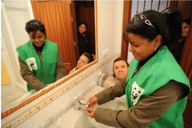
Instalación de un dispositivo de ahorro en Hinojos