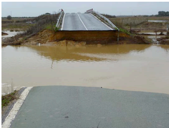
Camino de Villamanrique tras las lluvias de invierno de 2010

Ante esta decisión, WWF considera que la Junta de Andalucía debería tomar las medidas necesarias para dismantelar la vía –actualmente funciona ilegalmente como carretera- y asegurar su uso exclusivamente para tareas agrícolas y forestales, eliminando todos los tránsitos privados.