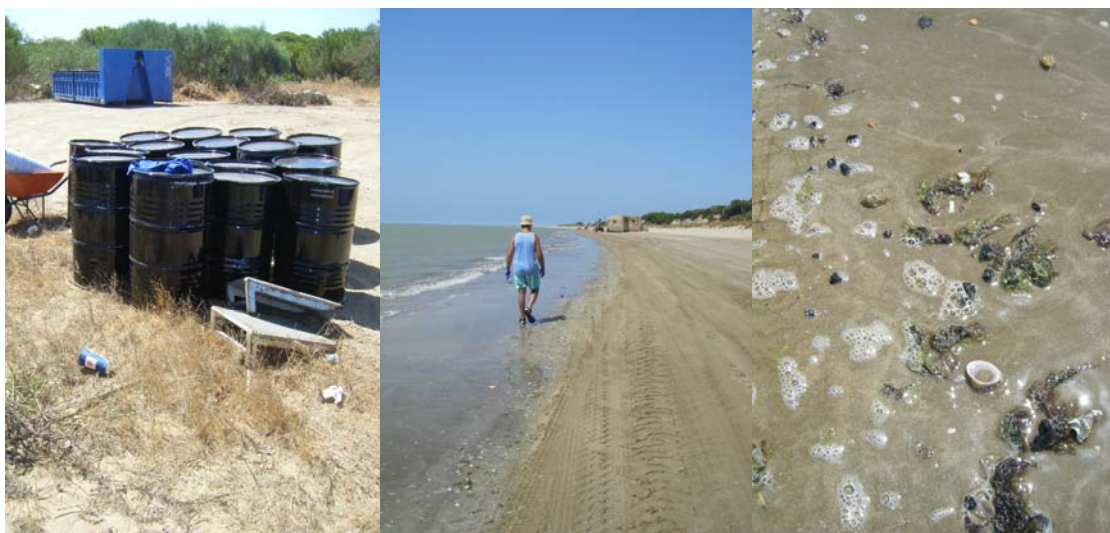
Imágenes de un vertido: punto de acopio en Matalascañas, personal del equipo de limpieza en Sanlúcar de Barrameda y chapapote en la Playa del Parque Nacional

Durante el pasado verano y el plazo de un mes y medio, la refinería de Cepsa en la Rábida (Palos de la Frontera) ha sido la causante de dos vertidos de petróleos. El primero de ellos procedente del buque SCF Caucasus afectó a unos 60 kilómetros del litoral onubense y llegó a playas de Cádiz. El segundo de ellos ocurrido en septiembre y procedente del buque petrolero Teide Spirit provocó una mancha de una extensión aproximada de 500 metros de largo por 50 de ancho que se dirigió a mar abierto.