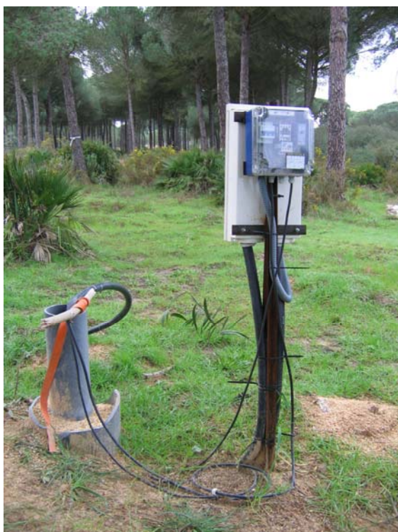
Pozo ilegal en el Condado

El Consejo de Gobierno andaluz aprobó en diciembre de 2007 la orden por la cual se redactaría el Plan Especial de Ordenación de las Zonas de Regadíos Ubicadas al Norte de la Corona de Doñana, con el objetivo de “solucionar el problema de la expansión de regadíos e invernaderos sin criterios de planificación, que en algunos casos han estrechado los corredores naturales, además de provocar la proliferación de las de las explotaciones e infraestructuras que no tienen en cuenta la racionalidad de costes y el impacto ambiental”.