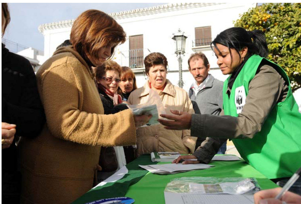
Entrega de kits de ahorro a los ciudadanos de Almonte

Esta campaña, a diferencia de las realizadas anteriormente, que se han centrado de forma exclusiva en la educación ambiental y la concienciación del ciudadano, ha permitido que junto a estas actividades se haya llevado a cabo una actuación directa que ha consistido en la implantación de sistemas economizadores de agua en las viviendas.