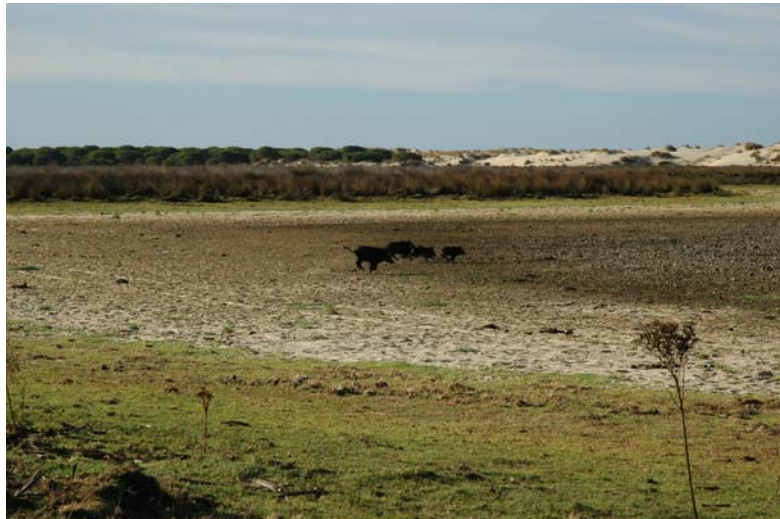
Laguna peridunar de Doñana

Posteriormente, un análisis de la Universidad de Huelva ha puesto en entredicho que todo el agua de riego del campo de golf provenga directamente de la depuradora de residuos sólidos urbanos, parece que también se esté usando agua proveniente del acuífero, lo cual contribuiría a empeorar la cuestión, al margen de la legalidad de las autorizaciones para el riego con agua de la red general o de pozos que extraen agua del acuífero.