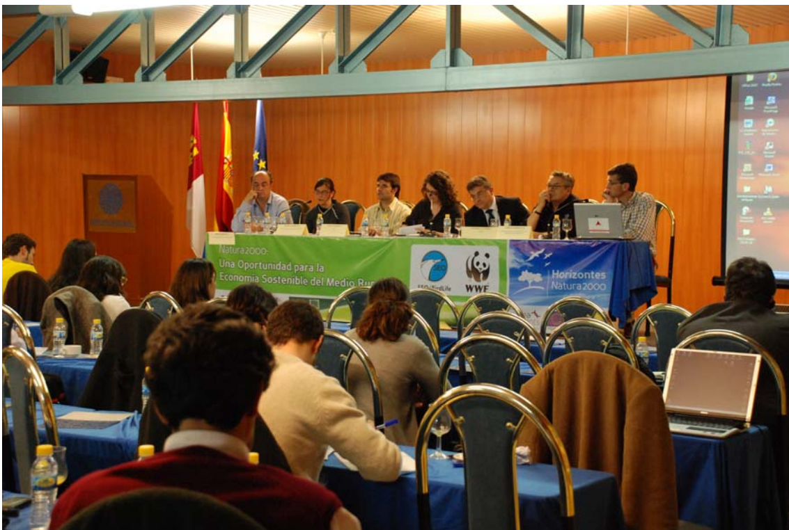
Imagen 23. Mesa redonda “Entre Montes y Montañas”