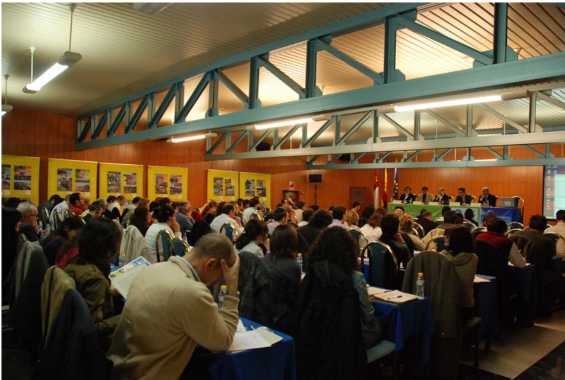
Imagen 4: Publico y sala de las Jornadas