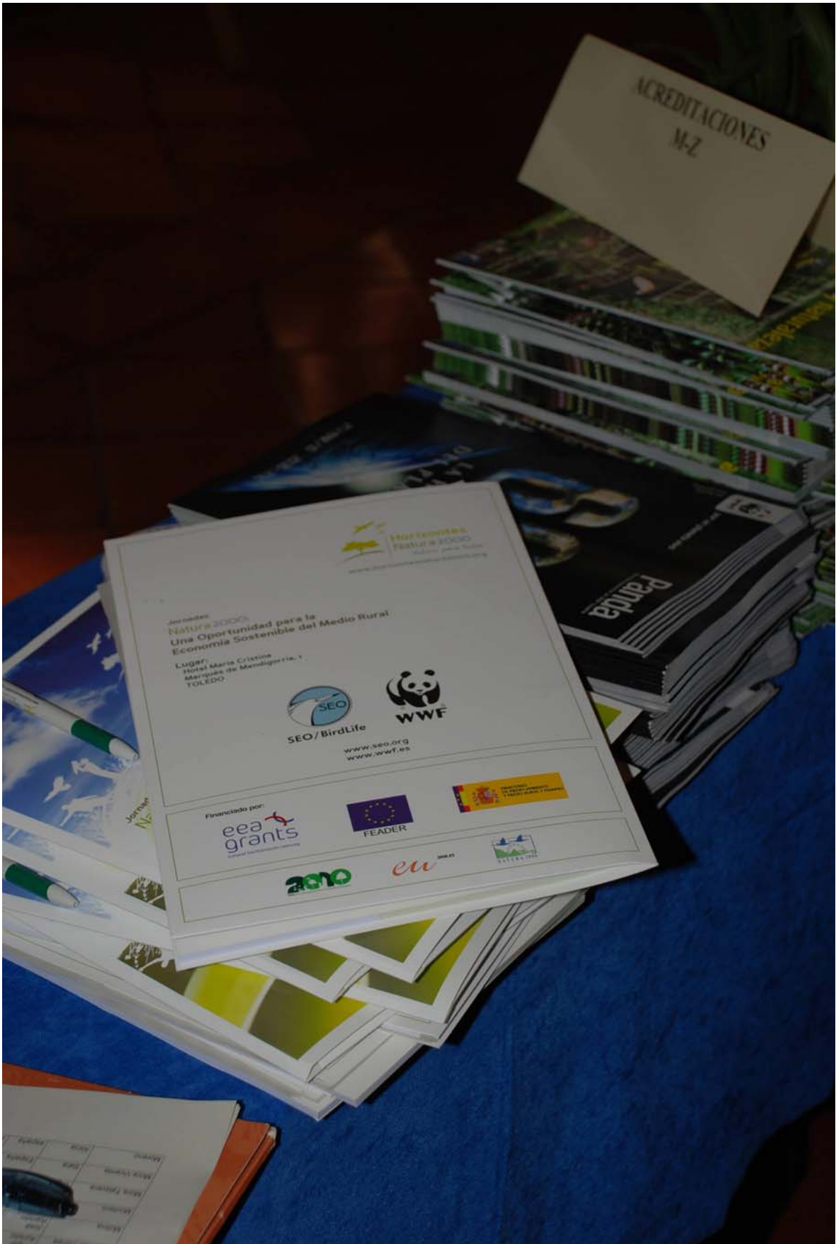
Imagen 1: Material entregado