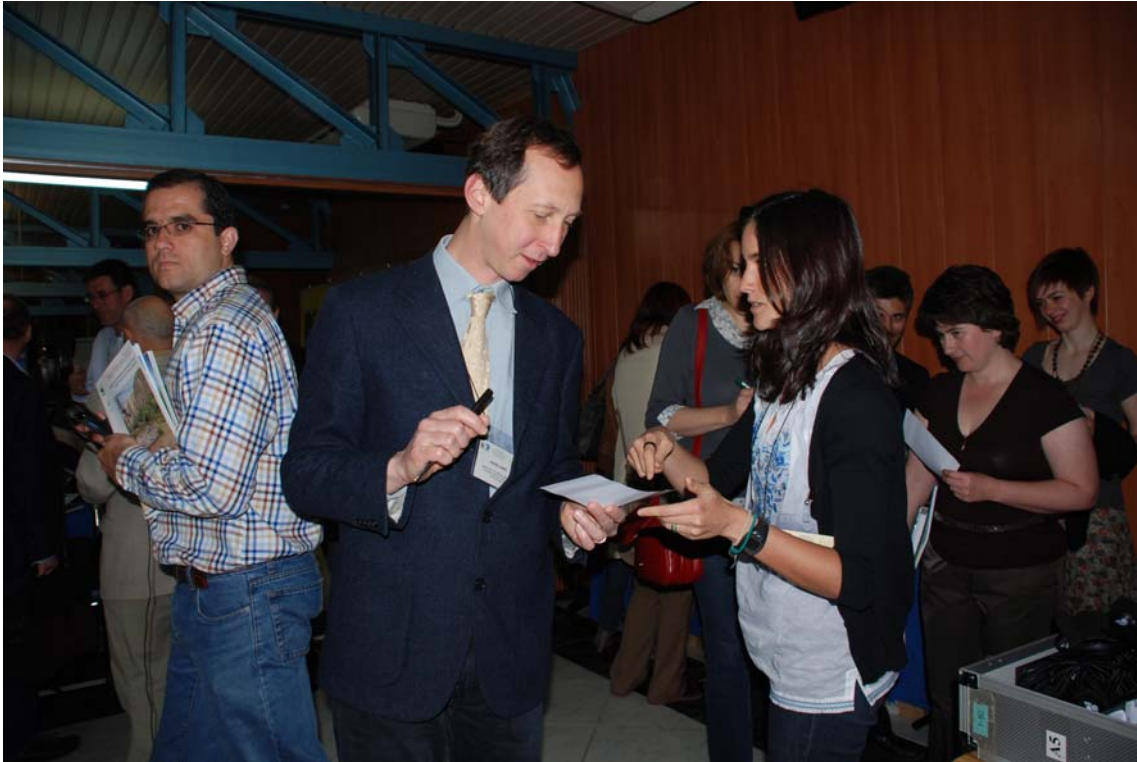
Imagen 3: Entrega de auriculares para la traducción simultánea inglés /español