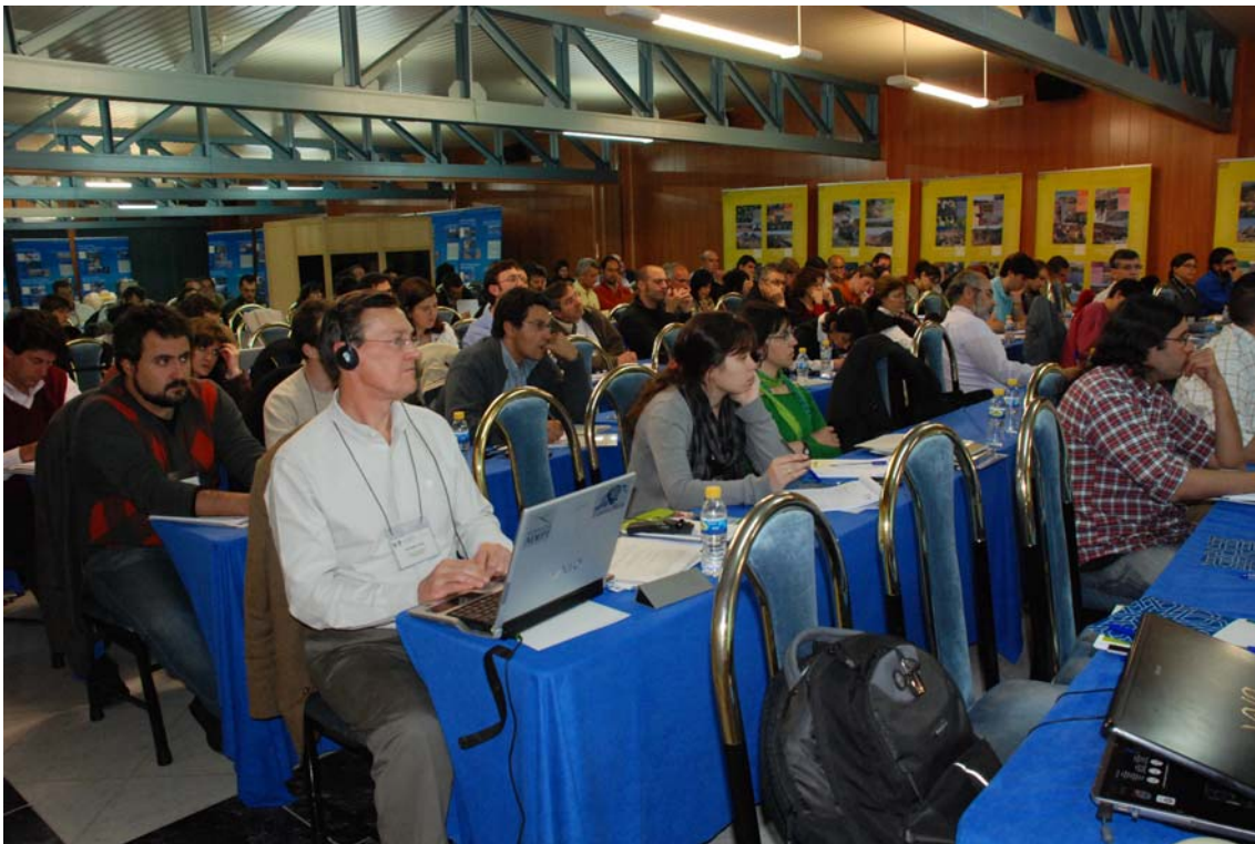
Imagen 18: Publico durante las Jornadas