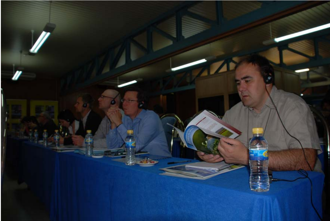
Imagen 5: Publico de las Jornadas