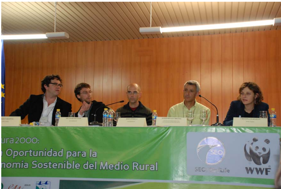
Imagen 11. Mesa Ponencias marco.