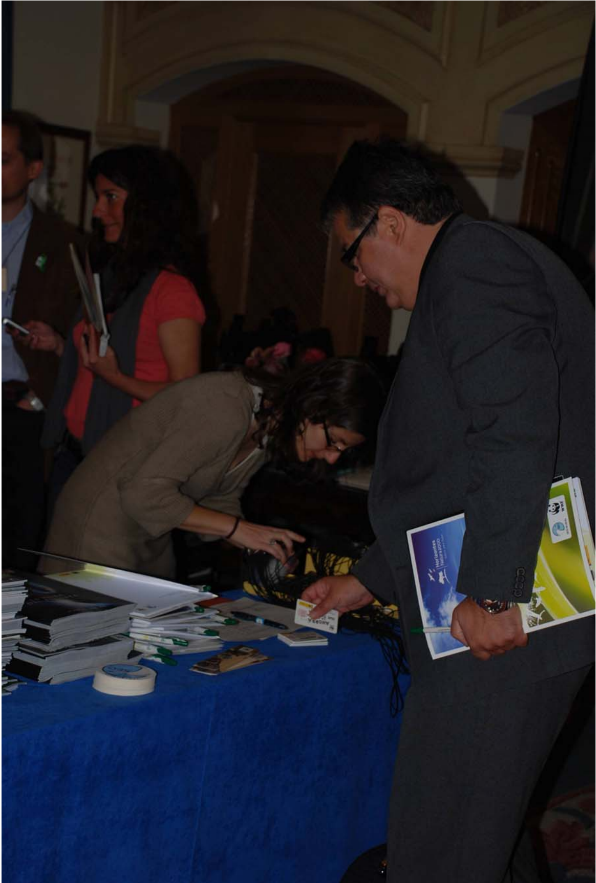
Imagen 2: Inscripciones