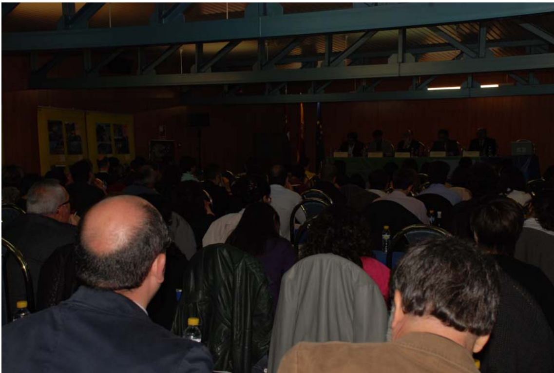
Imagen 6: Publico y sala de las Jornadas