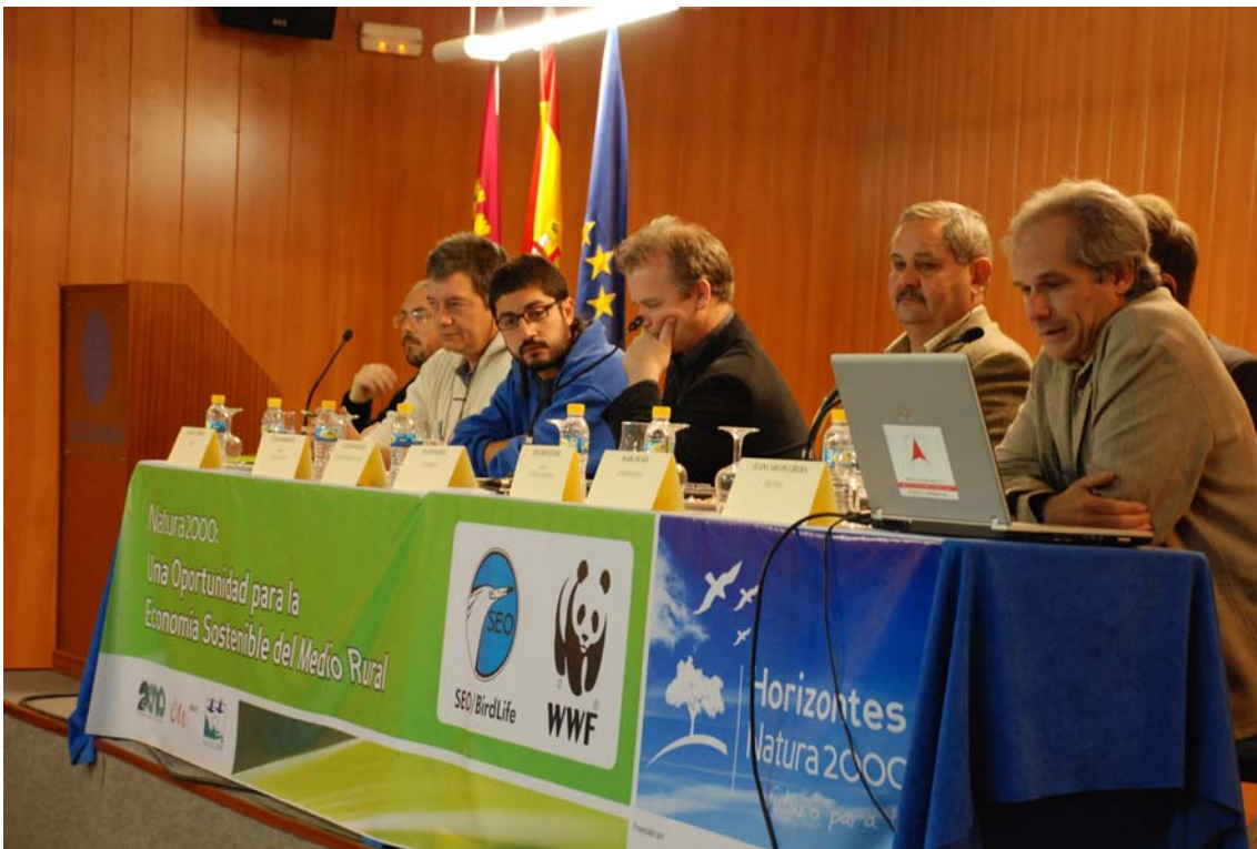
Imagen 26. Mesa Redonda. “En torno a los Humedales”