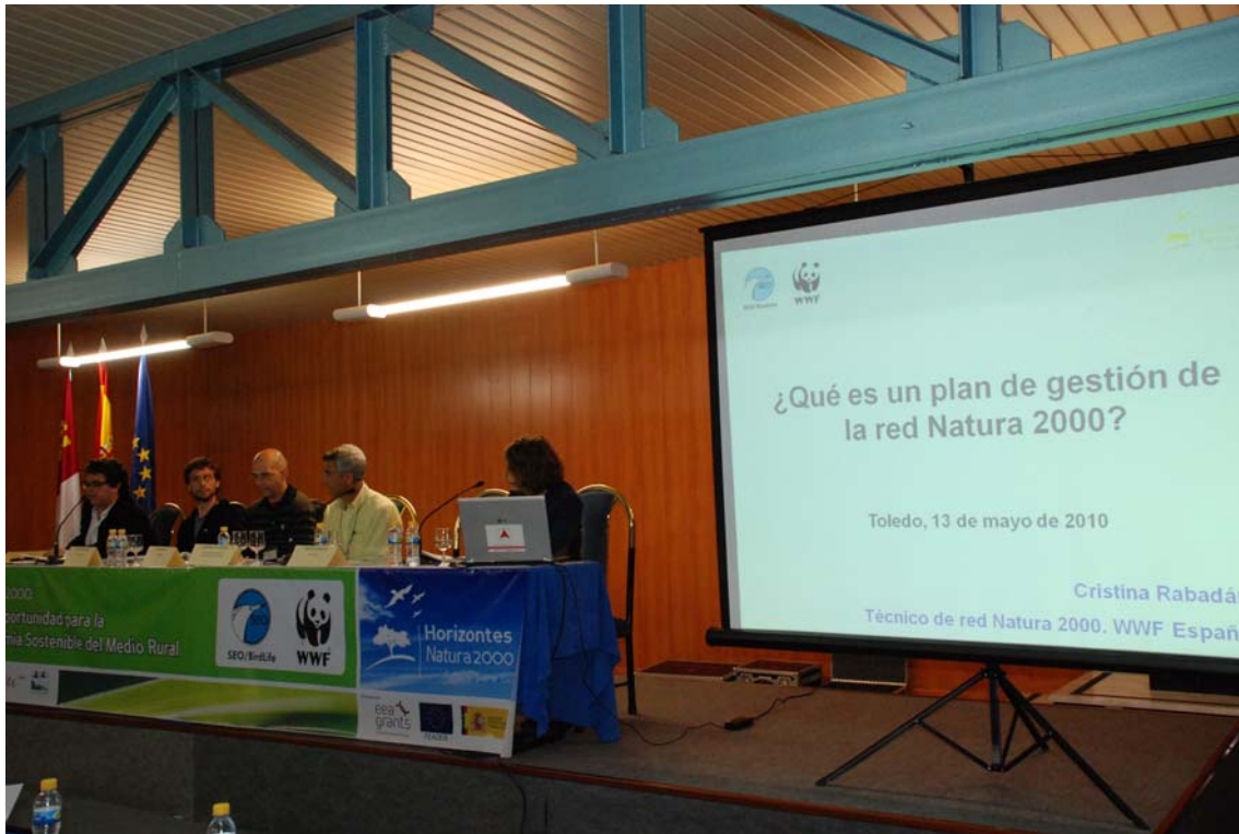
Imagen 10: Mesa de ponencias marco.