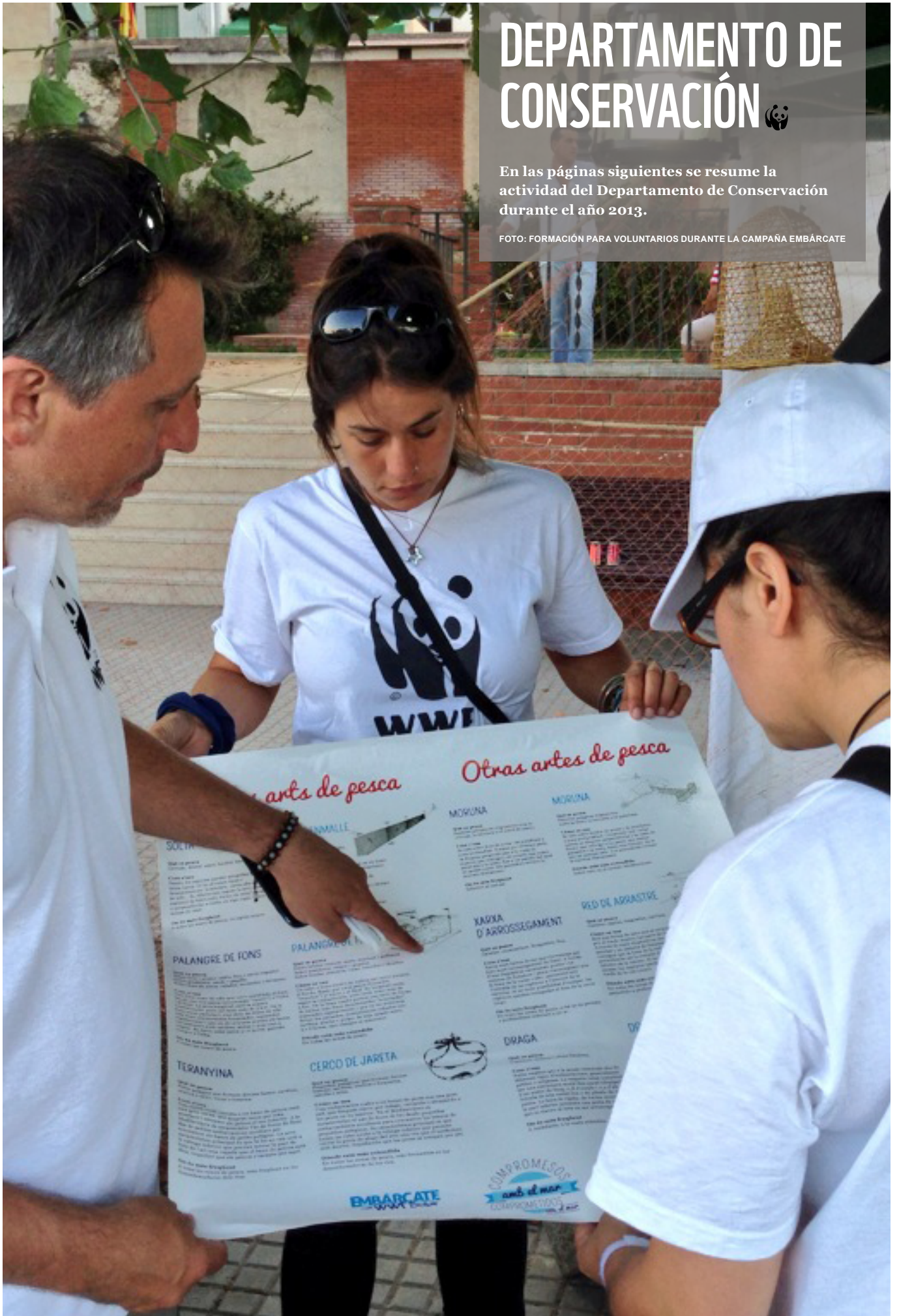
FOTO: FORMACIÓN PARA VOLUNTARIOS DURANTE LA CAMPAÑA EMBÁRCATE

En las páginas siguientes se resume la actividad del Departamento de Conservación durante el año 2013.