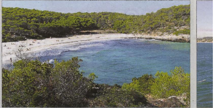
Playa Mondragó. Frente a la Mallorca devorada por el hormigón, emergen playas todavía no tocadas por el cemento que conservan la idiosincrasia de la costa balear